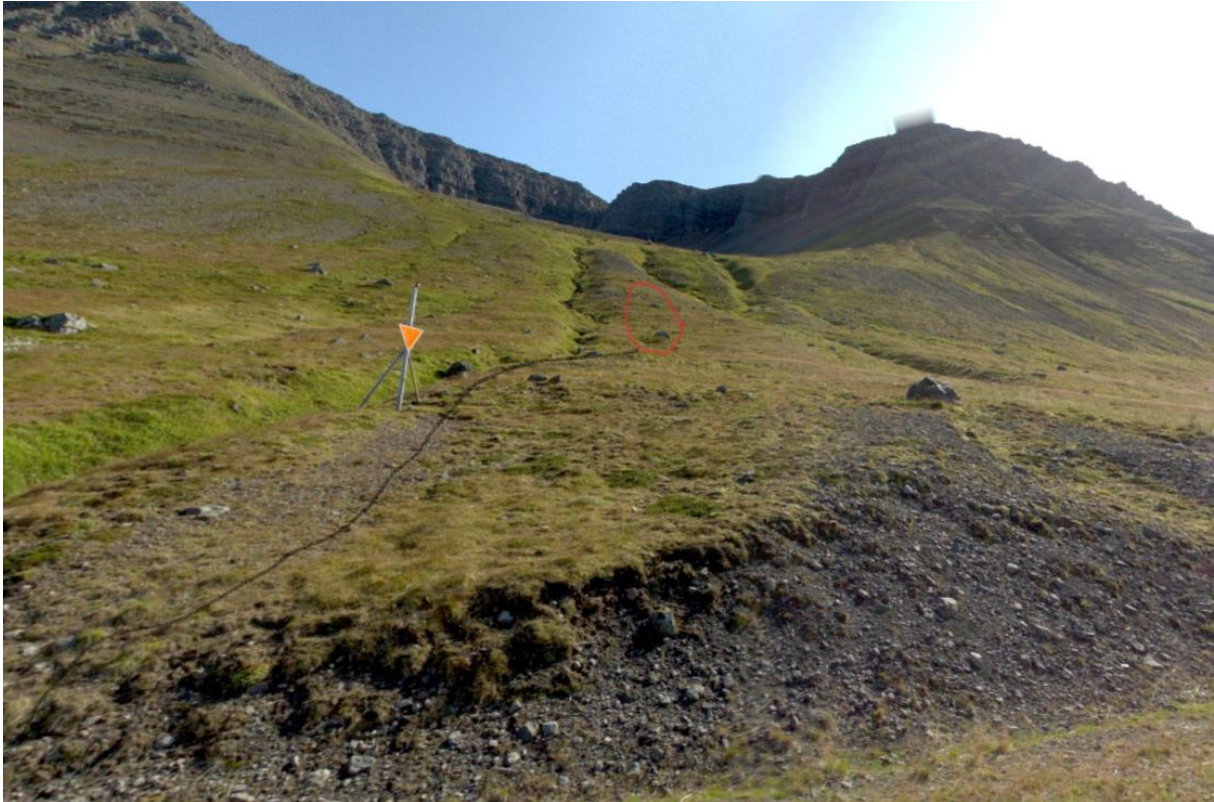
Mynd 1 Séð frá Þjóðvegi upp í Naustahvíft. Rauða svæðið er þar sem borun fer fram og þar sem þarf að gera sneiðinga, dökka línan kemst borvagninn upp með aðstoð gröfu.