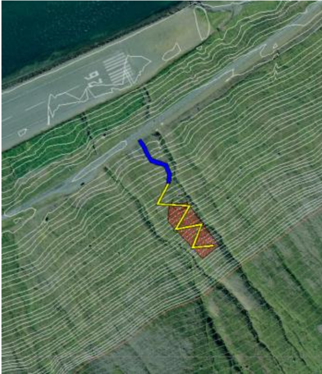
Mynd 3 Svæði neðan Naustahviltar. Blár litur er þar sem borvagn getur keyrt sjálfur eða með aðstoð gröfu, gult er sneiðingur, rautt svæði er þar sem borholur verða gerðar.