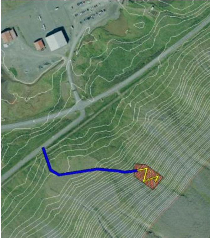
Mynd 5 Svæði ofan flugvallar gengt þverun Skutulsfjarðar. Blár litur er þar sem borvagn getur keyrt sjálfur eða með aðstoð gröfu, gult er sneiðingur, rautt svæði er þar sem borholur verða gerðar.