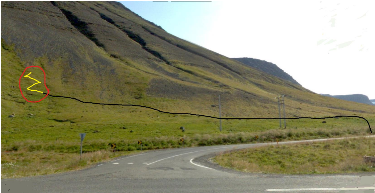
Mynd 4 Svæði ofan flugvallar gengt þverun Skutulsfjarðar. Dökkur litur er þar sem borvagn getur keyrt sjálfur eða með aðstoð gröfu, gult er sneiðingur, rautt svæði er þar sem borholur verða gerðar.